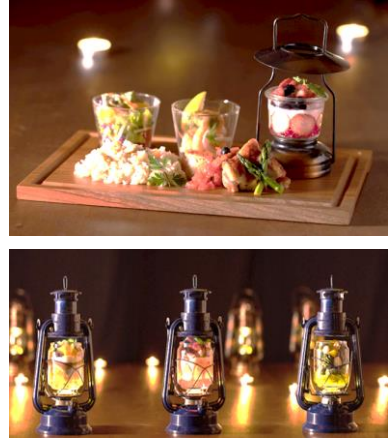
※パフェの器は全てランタンの形です