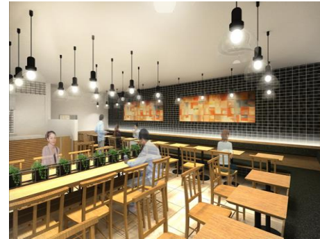
Soup Stock Tokyo