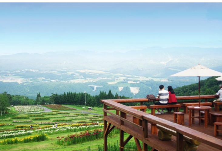
山頂の'ゆりテラス'から眺める絶景

ゆり観賞だけに留まらない様々なアクティビティをご用意して皆様に特別な1日をご提供いたします。