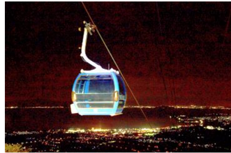
ナイトゴンドラ乗車風景