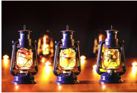
パフェ専門店ランプで提供するパフェ