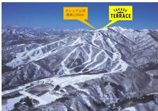
手前側:高鷲スノーパーク 奥側:ダイナランド

初日から標高1,550mの山頂より2,500mのロングラン(ダイヤモンドコース上部)が滑走可能となり、北向き斜面のコースは上質な雪質をお楽しみいただけます。今シーズンはおかげさまで20周年を迎え、山頂に新OPENする【TAKASU TERRACE】、海外旅行プレゼント企画、毎月20日に開催されるBIGイベント、20周年特別デザインタオルプレゼント、日本一の高さとかオリティを誇るスーパーパイプの誕生など長年の感謝を込めた記念企画をたくさんご用意しております。ハイシーズンには隣接する【ダイナランド】との往来も可能で2つのスキー場の総面積は西日本最大級の約180ha、ナゴヤドーム38個分の広さに匹敵し、初心者～上級者の幅広いニーズに合わせた、楽しみ方が自由自在なダントツBIGスケールゲレンデです。