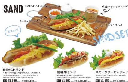
TAKASU TERRACE メニュー例